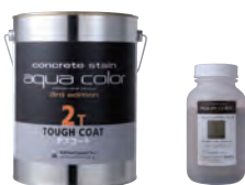
タフコート+カラーピグメント